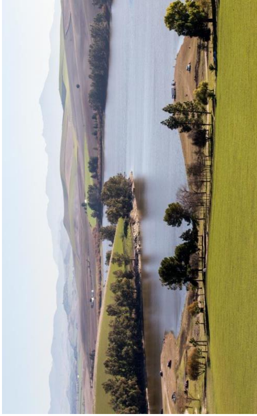
Embalse Torre del Águila.

En conjunto, estas estrategias pretenden garantizar la conservación activa del paisaje agrario y natural de El Palmar de Troya, integrando sus valores en la planificación urbanística y asegurando un modelo territorial sostenible.