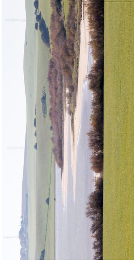
Laguna de Zarracatín.